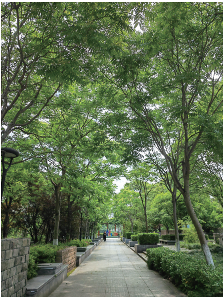
拍摄地：湖心公园