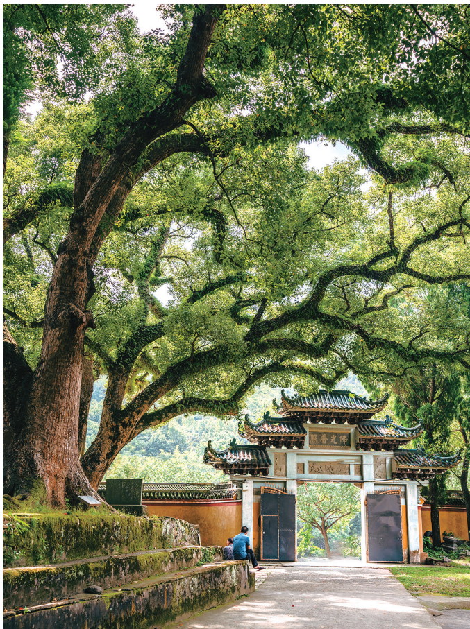
拍摄地：大溪流庆寺