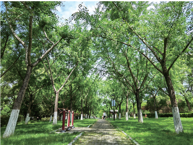
拍摄地：湖心公园