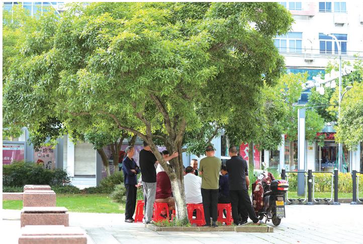
拍摄地：文沁公园