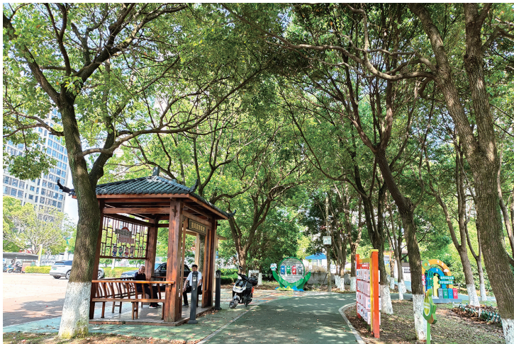
拍摄地：箬横镇健康公园