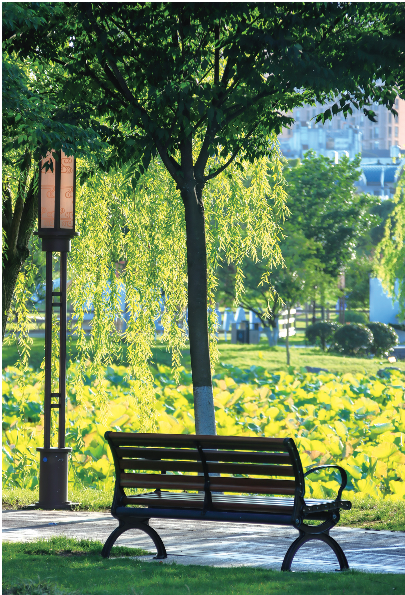
拍摄地：九龙汇公园荷花池附近