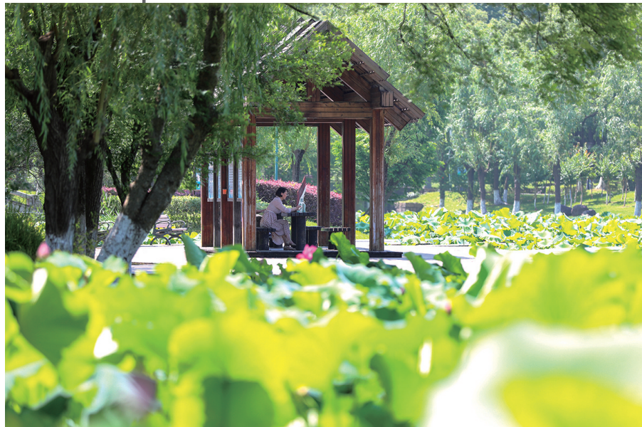
拍摄地：锦屏公园