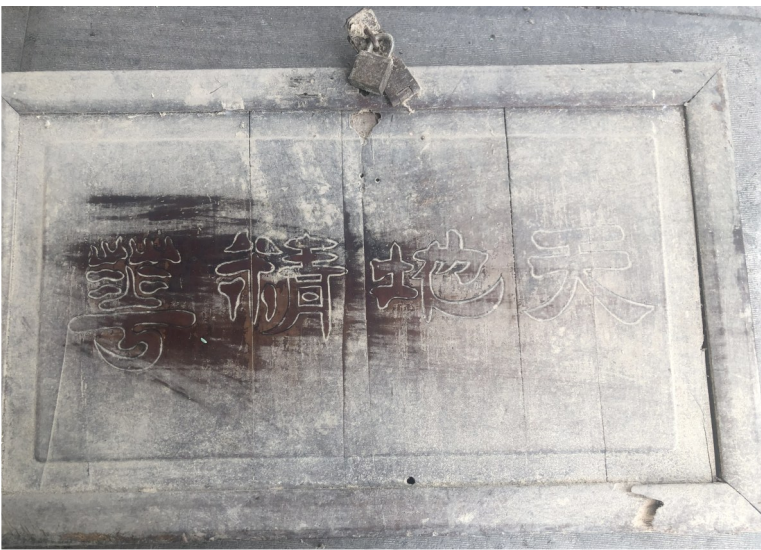
“天地精华”书籍盖子。