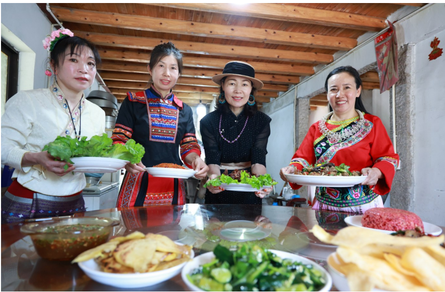
民族姐妹们展示自己的拿手菜。

“这次活动是街道深化民族团结进步创建的一个缩影。”城北街道相关负责人表示，依托“大统战”工作格局，街道精准对接各族群众的文化交流诉求，通过挖掘民族文化能人的示范作用，推动形成“统战搭台、群众唱戏”的生动局面，让民族团结工作既有高度更有温度。