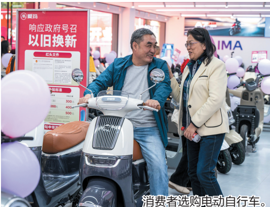
消费者选购电动自行车。

值得注意的是，在过往竞争最激烈的消费贷领域，今年并没有开启“价格战”。今年一季度，消费贷实际利率一度下探至3%以下，甚至低于同期LPR（贷款市场报价利率），引发监管关注。从