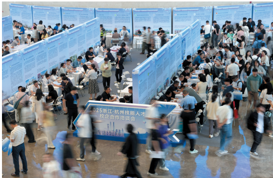
2025浙江·杭州技能人才校企合作洽谈会现场。

6月4日，人力资源和社会保障部发布消息称，为加快促进高质量充分就业，助力构建现代化产业体系，将在约30个具备条件的城市开展人力资源服务业与制造业融合发展试点。根据通知，试点城市将通过3年左右的时间，培育一批面向制造业的专业人力资源服务机构，打造一批融合发展平台载体和联合体，发展一批支持制造业高质量发展的的人力资源服务创新技术、产品、模式，形成一批推动人力资源和实体经济、科技创新深度协同的政策体系和有效模式。