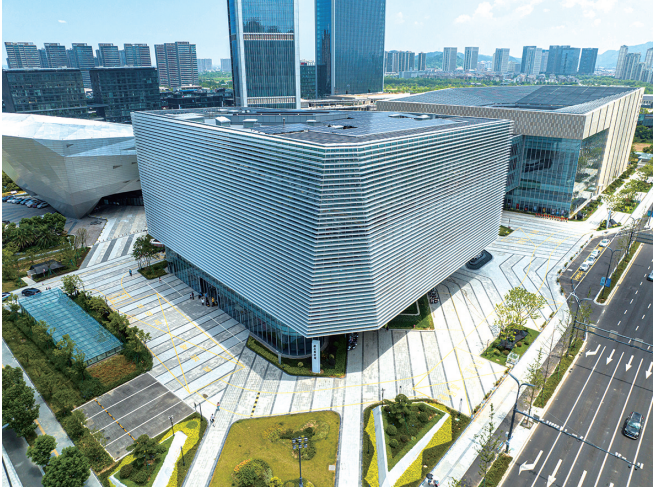
温岭文化中心建在渭川村内