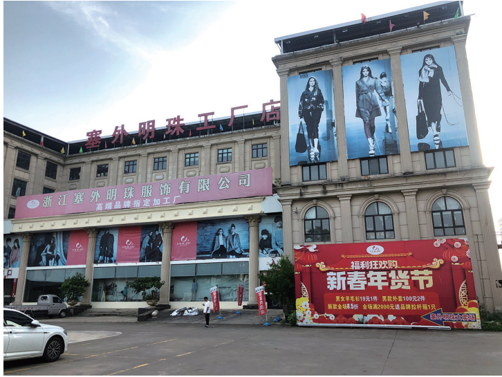
塞外明珠服饰有限公司