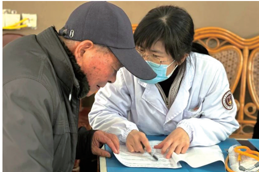
家庭医生为居民解读体检单。