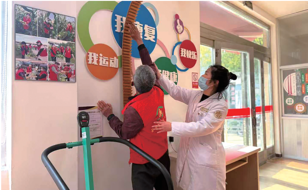
医护人员指导残疾人士进行康复训练。

此次箬横镇中心卫生院发起的“康复上门 让爱延伸”巡回活动，是为辖区内出行不便的群众专门设立的，包括健康检查、肢体功能训练、日常生活能力训练、心理疏导等内容。今年以来，该卫生院已为300多人次提供服务，让群众不出“村门”就能享受到个性化、多样化的康复服务。