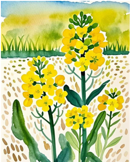
九龙小学九龙校区二(2)班 李知城 指导老师 郭晨怡

一年一度的石桥头油菜花节又到了!每当这个时候,石桥头镇就像被施了魔法,变成欢快的海洋。听说这次的“花漾石桥·春祈新愿”嘉年华活动特别精彩,我怀着无比期待的心情,约上同学们一起赶到现场。 刚到活动场地,美食的香气便扑鼻而来,我们瞬间被美食摊位区吸引。摊位一个挨着一个,热闹非凡。最抢手的要数羊肉串,我们果断点了30串。老板忙得不可开交,还担心我们买多了吃不完,可我们对自己的食量充满信心。在焦急等待的半个多小时里,我们紧紧盯着烤架,看着羊肉串在炭火上吱吱冒油,那香味直往鼻子里钻,馋得我们不停地咽口水。终于拿到了羊肉串,咬上一口,鲜嫩的羊肉在嘴里爆汁,外焦里嫩,香料的味道恰到好处,美味极了! 夜幕降临,篝火活动开始啦!熊熊燃烧的篝火照亮了夜空,大家围在篝火旁,脸上洋溢着灿烂的笑容。少数民族舞者们穿着漂亮的服饰,热情地领跳篝火舞,他们的动作优美又奔放,大家都被感染,纷纷跟着舞动起来。 这时,凤凰传奇的歌曲突然响起,我和同学们瞬间化身为凤凰传奇的“粉丝”。虽然没有荧光棒,但我们丝毫不受影响,跟着节奏尽情摇摆身体,双手在空中用力挥舞。欢快的歌声、笑声、呼喊声交织在一起,和熊熊燃烧的篝火相互映衬,将现场的气氛推向了高潮。 这个夜晚,有美食的满足,有音乐的快乐,更有大家相聚的温暖。我在心里默默期待,下一次还要来这里,收获更多惊喜,再度过这样欢乐无比的时光。