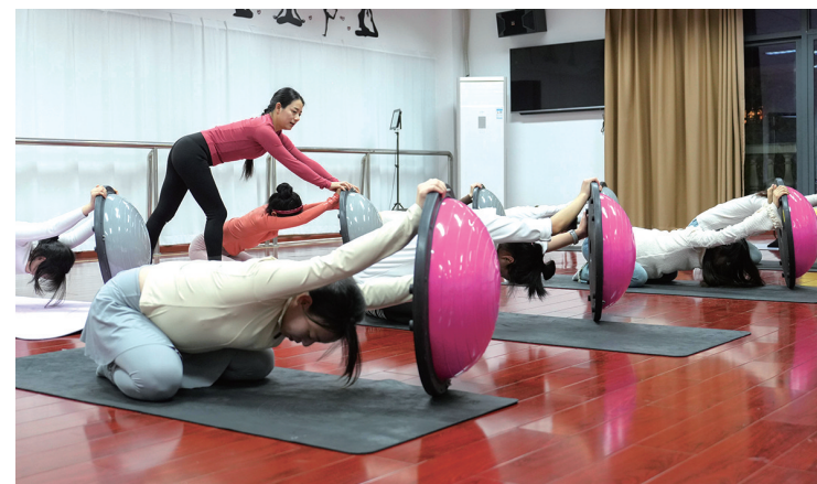
2024年11月20日晚，在重庆市北碚区水土街道万寿社区青年夜校，青年职工在老师指导下练习瑜伽。

中国产业研究院发布的《2025—2030年中国健康养生行业投资潜力及发展前景预测报告》分析，15—25岁的年轻人群体逐渐成为健康养生市场的主力军，养生手段呈现出多样化的特点。