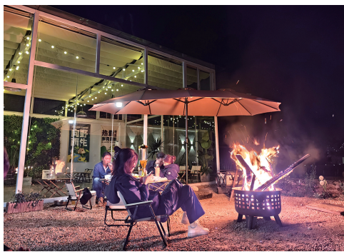
客人在星月手作农场欣赏篝火。

去年7月，人力资源和社会保障部将19个新职业、28个新工种纳入国家职业分类大典，包括文创产品策划运营师、滑雪巡救员等