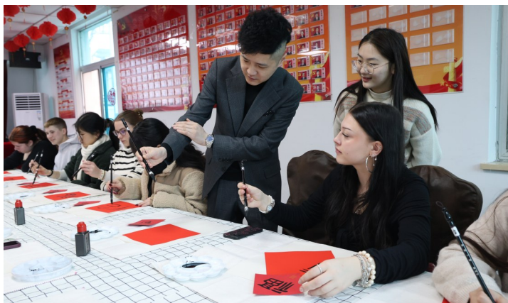
在温岭市第二中学进行文化交流的25名德国中学生，走进方城社区，在老师的手把手指导下，动手剪窗花，写“福”字，体验中国传统文化。