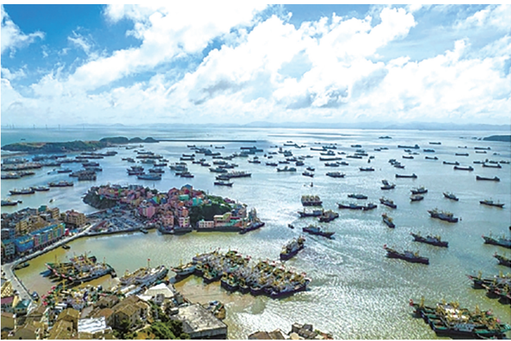
石塘镇风光。

在石塘镇千年曙光碑下，悬挑在崖壁之上的曙光湾酒店完成主体结顶，初具雏形。“接下来，要加快推进后山精品石屋、配套服务片区的建设，确保曙光湾酒店2026年5月1日前开业。”温岭市文旅集团相关负责人说。 这是石塘文旅产业转型升级、美丽蜕变的关键落笔。作为浙江省扩大有效投资“千项万亿”工程2024年重大建设项目，东海好望角全域旅游提升项目总投资约75亿元，创温岭史上文旅项目投资额之最，将对石塘的曙光湾、曙光碑、石塘新村、元龙岙沙滩、后山、油库、海岛等8个片区进行分区分期的全域旅游提升改造，打造浙江滨海引人入胜的精彩目的地。 做好“网”字文章，与广阔世界相连。去年9月25日，“海上公路”81省道石塘支线建成通车，形成石塘半岛交通环线，串联起陈和隆旧宅、石塘老街、中心渔港等多个知名景点。去年年底，滨海新城精品线路一期实现从黄坭新村至七彩小岛全线贯通。精品线路二期已开工建设，未来将用2到3年时间全面构建环