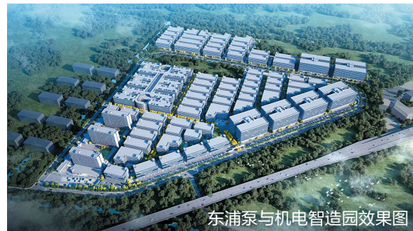
东浦泵与机电智造园效果图