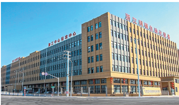
“北域工城”高端装备制造园。

此外，箬横镇还将同步推进毗邻的高端装备制造园二期建设。截至目前，园区已有亿达传动、田邦齿轮、金日机械3家企业签约入驻，预计2025年8月开工建设。全部建成后，高端装备制造园将成为“北域工城”范围内最大的高能级产业平台。