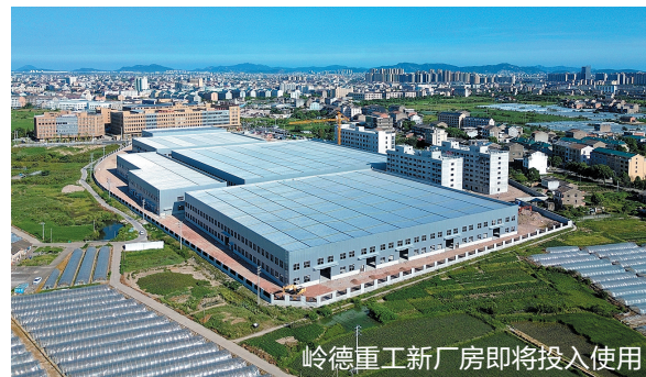
岭德重工新厂房即将投入使用

建成投用后，预计容纳泵与电机、机床工具等产业及上下游产业链企业300多家，其中规模企业40家以上，可直接提供1万个就业岗位，实现年入库税收1.5亿元以上。