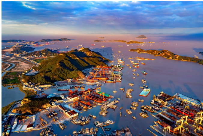
礁山渔港。

立足“两城两湖”战略格局，加速建设“人港产城文旅”一体化融合发展的现代化滨海新城，全力争创国家级经开区。