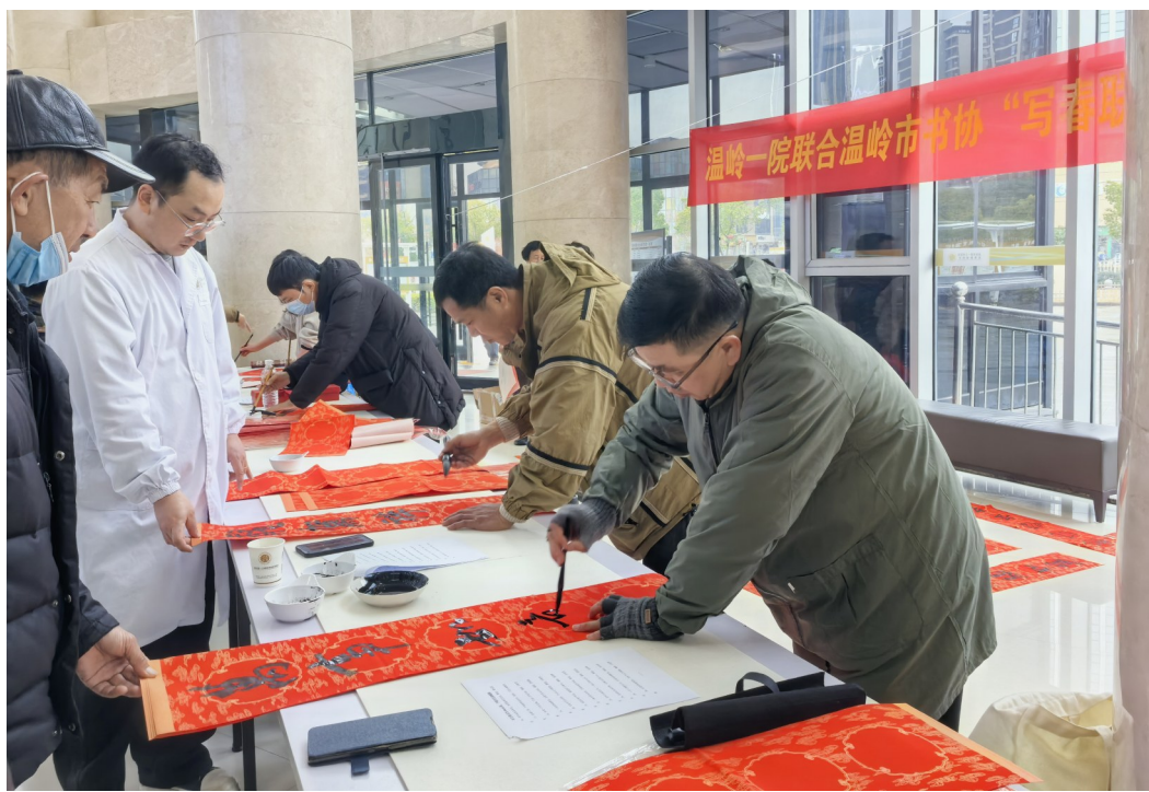
1月23日,温岭市第一人民医院滨海新城院区门诊大厅内,红纸翻飞、墨香阵阵,热闹非凡。6位书法家现场挥毫泼墨,为市民朋友以及本院职工书写春联,绘制新符。活动吸引了众多市民前来,定制春联备受青睐,还有不同字体的“福”字,可供市民随意挑选。现场共送出200余副春联。