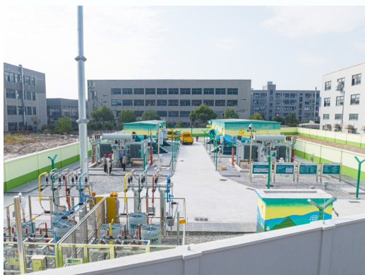
2024年12月3日，35千伏青屿输变电工程正式投运。

岁月不居，时光如流。2024年，是实现“十四五”规划目标任务的关键之年，也是国网温岭市供电公司发展固本强基、转型升级的一年。这一年，国网温岭市供电公司以实干实绩的姿态，在逐新之路上昂首挺胸，勇往直前。220千伏松门滩涂送出工程、110千伏横峰输变电工程、35千伏青屿输变电工程相继投运，为地方经济社会发展提供有力支撑。 这一年，国网温岭市供电公司的电力人用兢兢业业的心，守护着跨越群山的万家灯火。全年全社会用电量86.42千瓦时，同比增长9.48%；最高负荷高达175.7万千瓦，同比增长11.01%。 这一年，国网温岭市供电公司在未知中勇敢探索，将每一个问号拉直成惊叹号。供电所优化管理持续提升，变电“运检合一”改革稳步推进，电力应急处置能力全面加强，电网运维水平精益求精，书写着电力事业的新篇章。 这一年，国网温岭市供电公司坚定不移服务全市工作大局，绘就一幅电力事业蓬勃发展的壮丽画卷。数字化服务产品“电费管家”为全国超11万家企业提供用电优化建议，累计节省用电成本超2亿元，工作成效获社会各界广泛认可。 每一刻的奋斗都铭记于心，每一份的成就都熠熠生辉。又一个四季轮回中，国网温岭市供电公司的铁军以坚韧不拔的意志和勇往直前的精神，谱写新时代的华丽篇章。