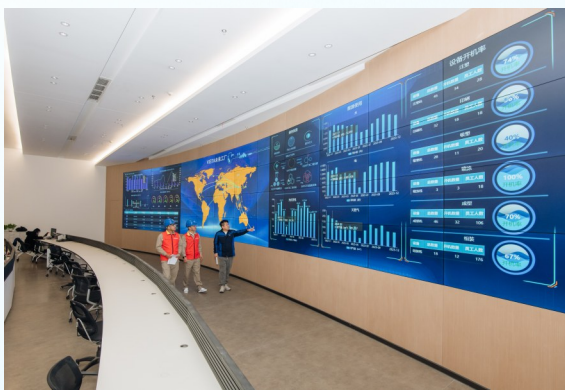
2024年1月30日，国网温岭市供电公司员工通过“电费管家”，给企业出具“体检报告”。