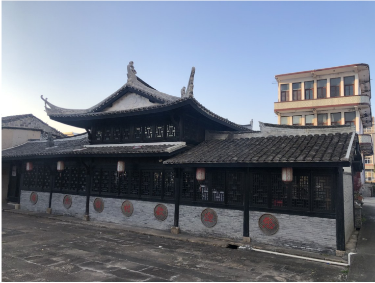
修缮的一处四合院。