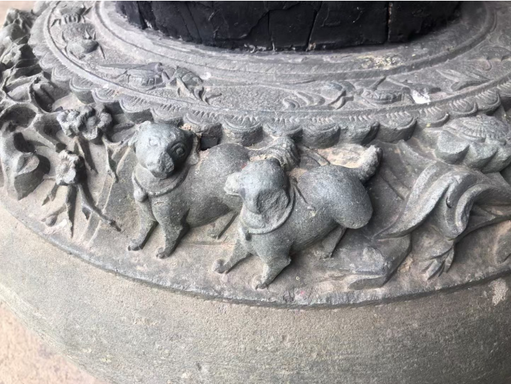
高龙书院青石柱础。