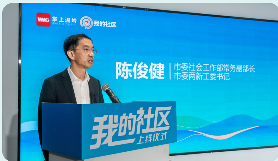
市委社会工作部领导推介“我的社区”平台。