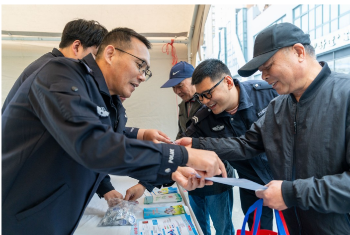
社区民警向居民宣传反诈知识。