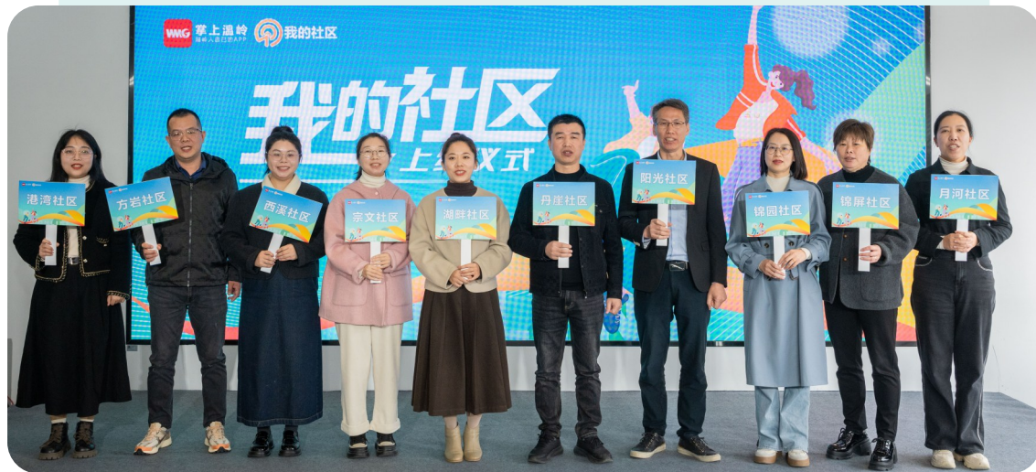
试点社区相关负责人合影。