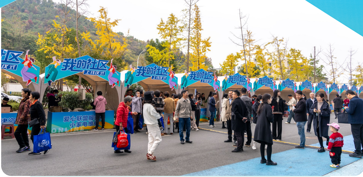
“我的社区”嘉年华上，人头攒动。