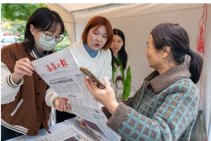
社区驻点记者向居民介绍“家有喜事”版面。