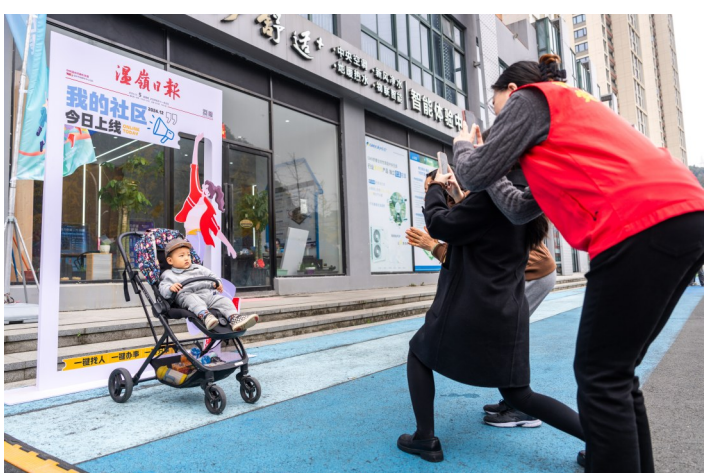
居民在温岭日报展板前拍照打卡。