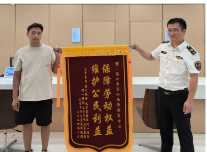
市劳动保障服务窗口