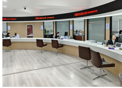
市人民法院诉讼服务窗口