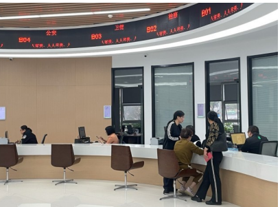
信访受理服务窗口