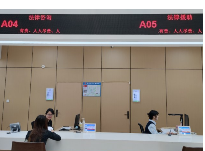
法律咨询、法律援助窗口