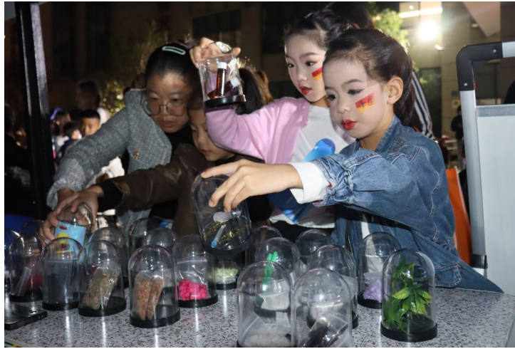
巧眼辨毒体验项目。

“讲好企业故事”演讲大赛将通过分组预赛、晋级赛和决赛的形式有序进行，获奖的优秀企业故事将入选由中国企业文化促进会主编的《中国企业故事（温岭卷）》。