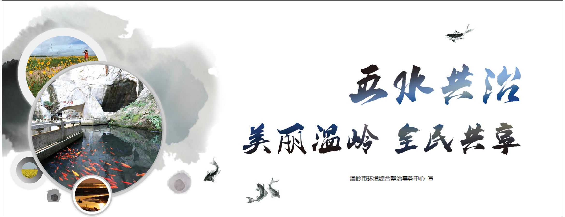
温岭市环境综合整治事务中心 宣