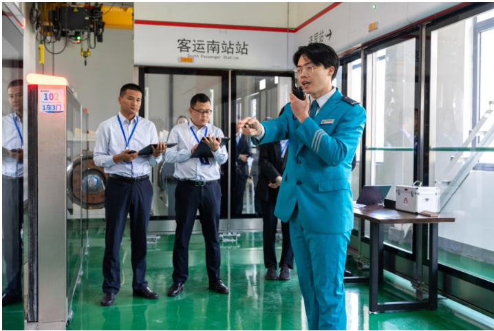
服务员类比赛项目中，选手在按照指令进行操作。