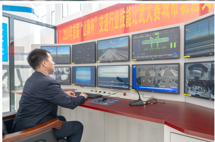
模拟驾驶室的考核系统。