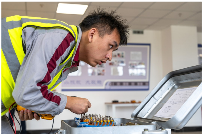
选手正在观察电器参数。