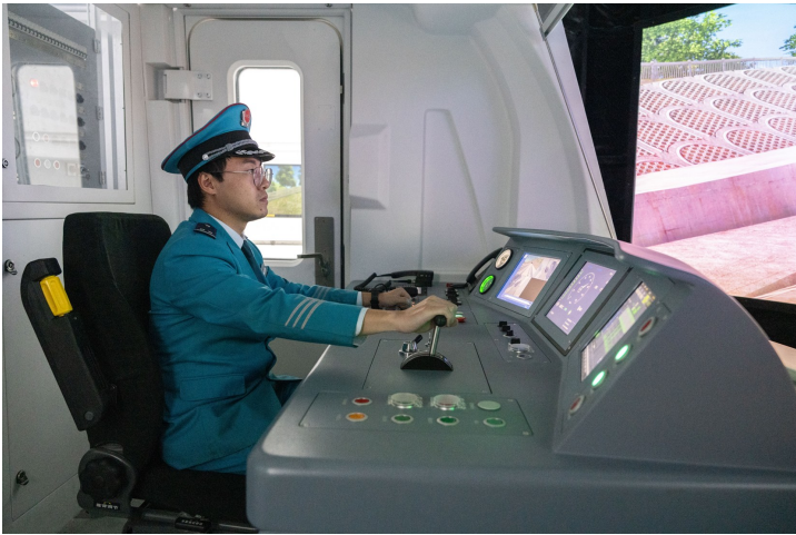
列车司机实操考核赛中，选手正在模拟驾驶。