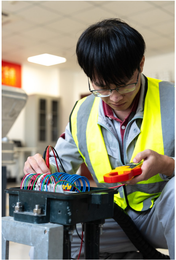
信号工类项目中，选手正在进行故障排查与处理。