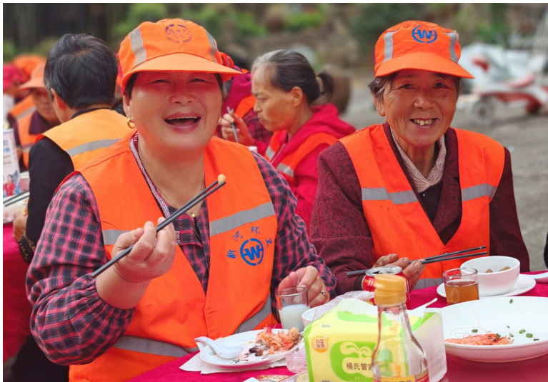
环卫工人们高兴地享用爱心大餐。