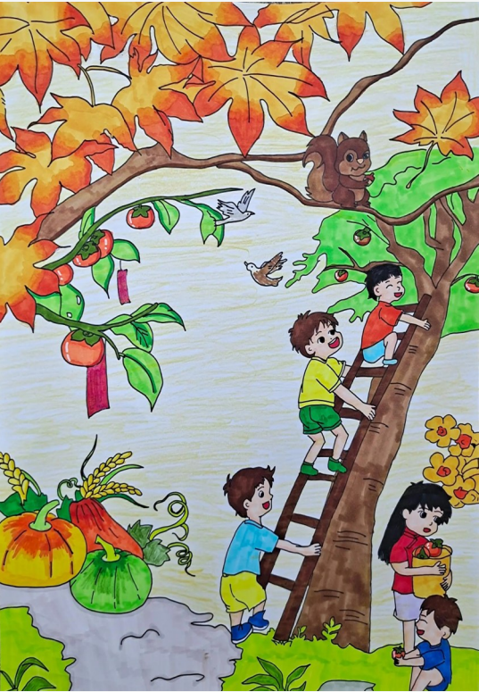
《秋野拾趣》 箬横小学六(1)班 周添一