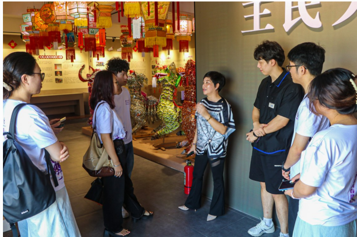
实践团成员正在了解王氏大花灯的历史背景、制作工艺。