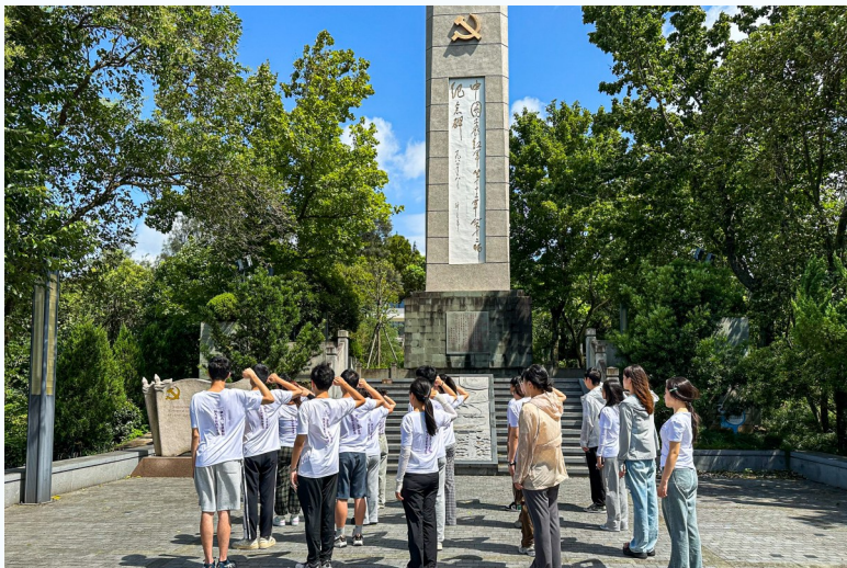
实践团全体成员重温入党誓词。