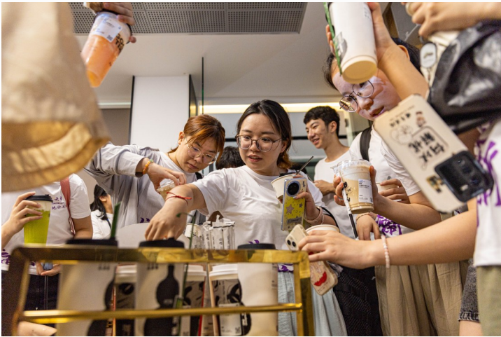
实践团成员现场品鉴企业开发的新饮品。