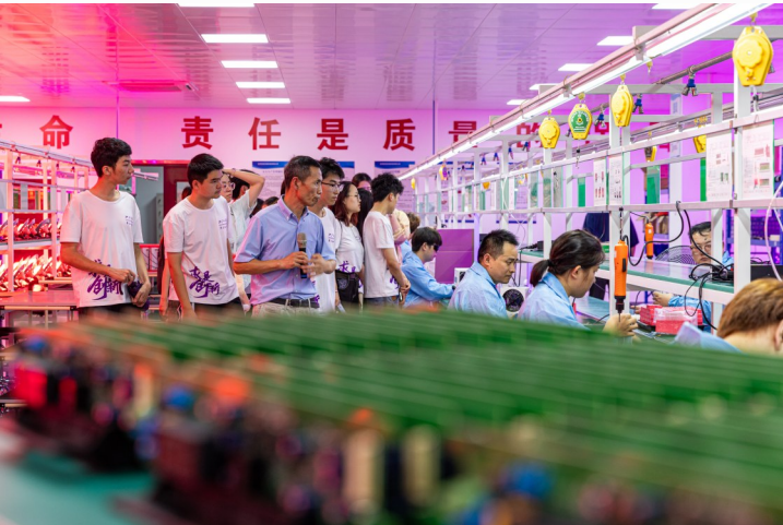
企业负责人带领实践团成员参观车间生产线。