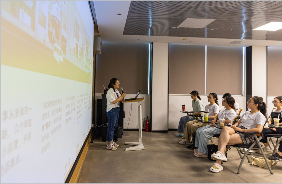
企业负责人向实践团成员讲解农业灯具相关知识。