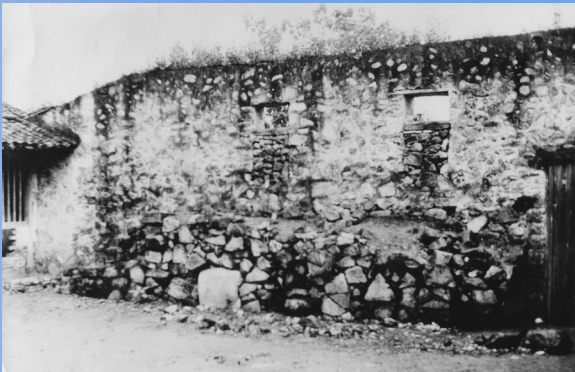
红二团（师）整训地址——西门岛娘娘庙一角。