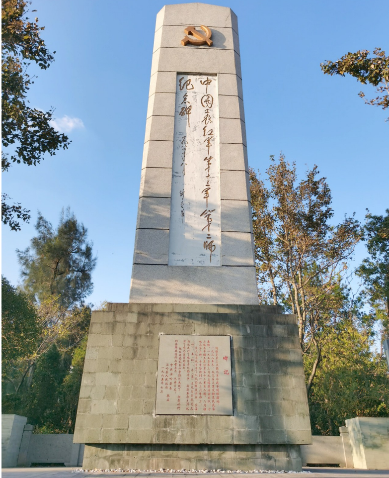
中国工农红军第十三军第二师纪念碑。

当前进的枪声在祖国东部响起，温岭的海岸线上，有一支队伍如同海燕翱翔于波涛之上，坚定而顽强。1928年至1938年间，温岭首支红色武装前后经历了50余次战斗，其中规模较大的反“围剿”战斗就有5次。在长达10年的艰苦斗争中，150多名战士的英勇牺牲让温岭大地上遍布着红色印记。