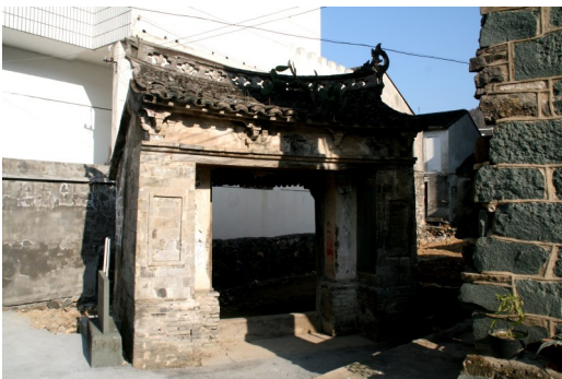
坞根洋呈红二团指挥部台门遗址。

红二师余部占据海岛，与国民党地方武装抗衡。温岭县政府和国民党浙江省保安司令部恐慌至极，试图通过说降的方式许以赵裕平高官厚禄。然而，无论是金钱的诱惑还是威胁恐吓，都无法动摇赵裕平的决心。他坚定地表示：“成则无愧，败则成仁；屈膝投降，无耻受禄，非党所为。”这种坚定的信念和无畏的精神，使他在困难面前毫不退缩，始终坚守在抗争的第一线。