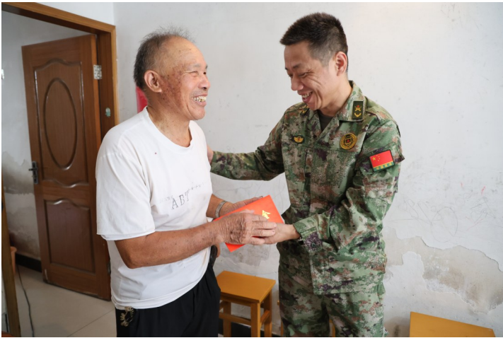
街道武装部相关负责人慰问困难退役军人。通讯员 郑成辉 摄

本报讯（记者辛雨吟 通讯员郑成辉）“平时需要什么帮助，尽管和我们提。”7月23日上午，太平街道退役军人服务站组织联合街道慈善分会，在街道相关负责人的带领下，对立功受奖个人、艰苦边远地区服役官兵家属和困难退役军人家庭进行慰问。这几位军人中，有的在技能大比武中取得第一名，荣立三等功，有的正在边远地区服役，还有的则是困难退役军人。