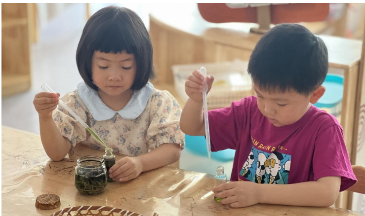
孩子们在尝试制作驱蚊水。

原来驱蚊水是用这些材料制成的呀，真神奇！没想到平常不起眼的艾叶有这么多功能，让我增强了对中医药文化的兴趣。小朋友们纷纷感慨。幼儿园相关负责人表示，希望借此契机，让孩子们感知中医药文化的魅力，激发他们继续探索中草药奥秘的兴趣。接下来，幼儿园将继续组织开展传承中医药文化、弘扬中华优秀传统文化等创意活动，丰富孩子们的暑期生活，锻炼其创造力和动手能力。