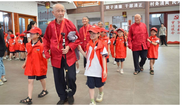
少先队员搀扶着老人入场。

城南镇相关负责人表示，此次活动进一步增强了志愿者们爱党、爱国、爱家乡的情怀，也让少先队员们深刻认识到军人在保家卫国方面的重要作用，激发了他们对军人的尊敬和热爱之情，使他们自觉地树立起国防意识和为家乡努力奋斗的理想信念。下一步，该镇将继续深入挖掘辖区红色资源，广泛开展国防动员教育活动，让红色基因代代相传。