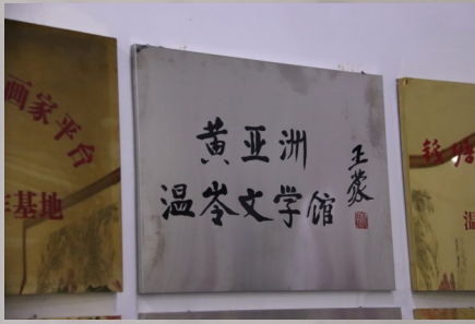
中国当代著名作家王蒙题写馆名。

黄亚洲温岭文学馆对助推我市的文学创作和创作成果的创造性转化具有重要意义。笔者寄望黄亚洲这一建在温岭东部的文学花园，结出更多的文学成果，溢香浙江东南。