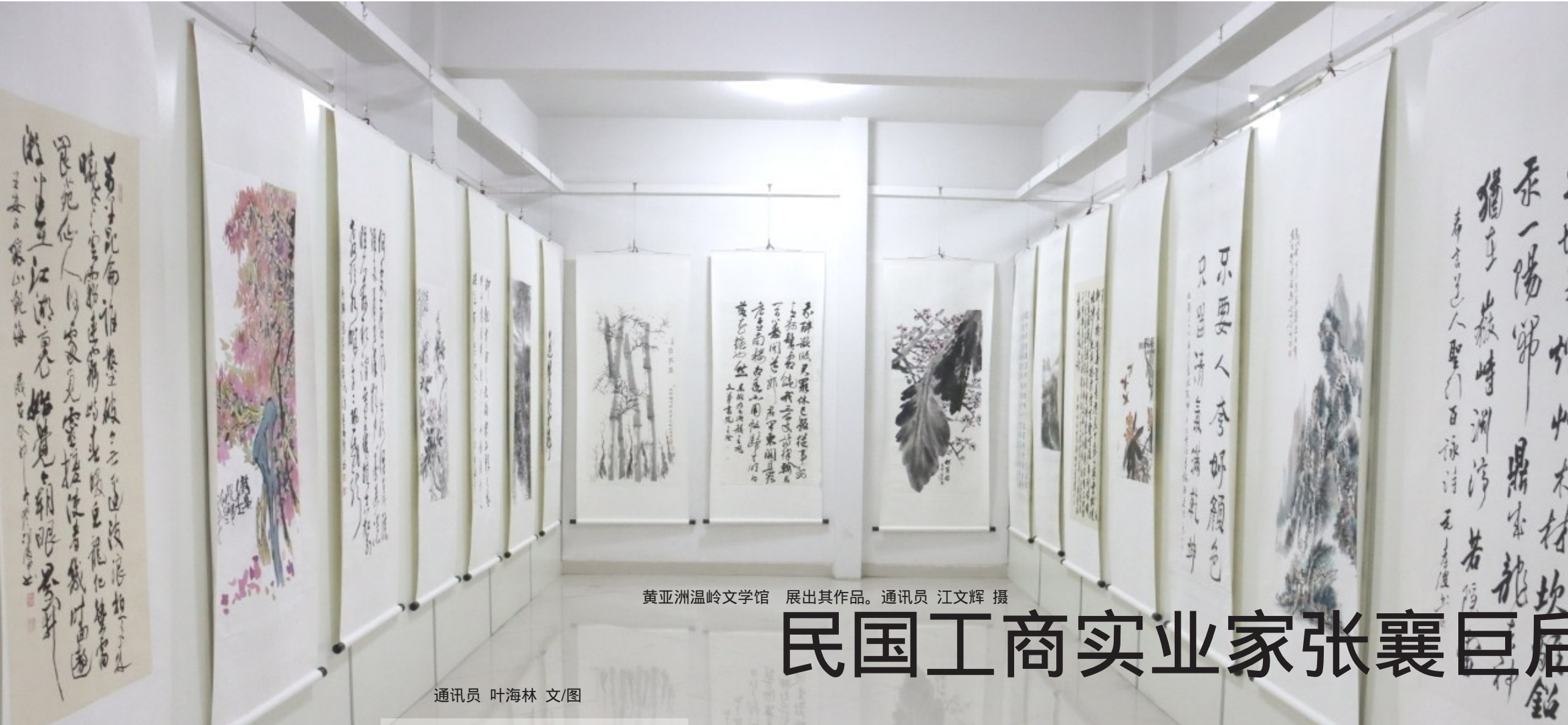
黄亚洲温岭文学馆 展出其作品。