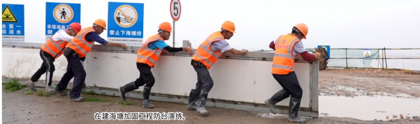
在建海塘加固工程防台演练。