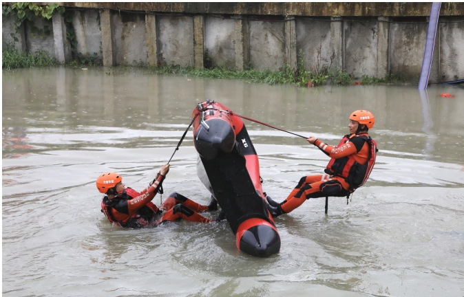
翻舟自救演练。