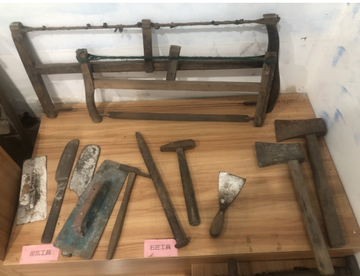
木工、石匠、泥瓦匠的工具。

记者随后来到村文化礼堂参观，发现里面陈列着不少老物件，像高脚桶、筛粉桶、煤油灯、镬壶、铜火炉、石匠工具、泥瓦匠工具、木工工具等。记者饶有趣味地将这些老物件一一拍照留存，