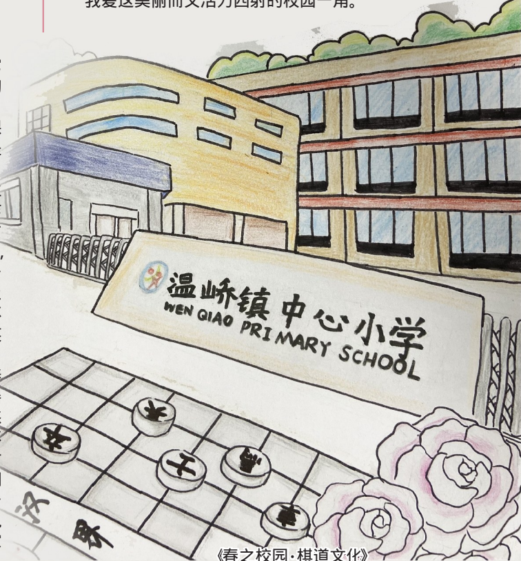
《春之校园·棋道文化》

春日的操场给校园增添了生机，是我们快乐成长的地方，我爱这美丽而又活力四射的校园一角。