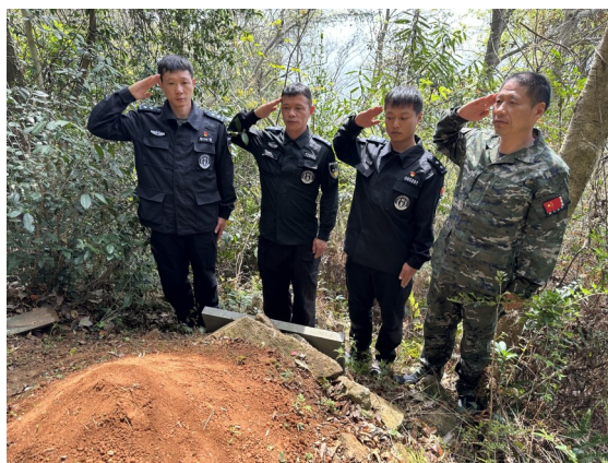
训导员们悼念 战友。记者 赵云 摄