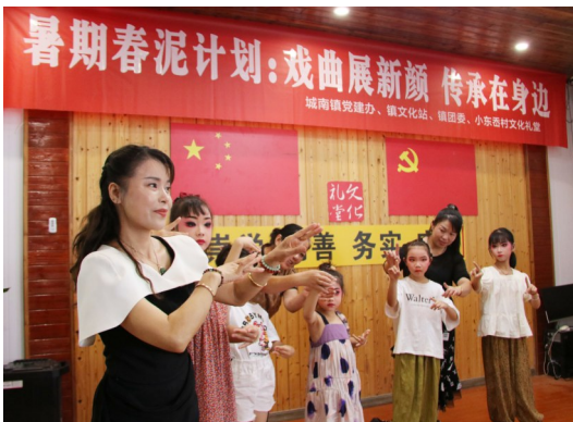
2023年7月20日，城南镇在小东岙村文化礼堂举办《戏曲展新颜 传承在身边》暑期春泥计划活动，让小朋友们感受越剧的独特文化魅力。