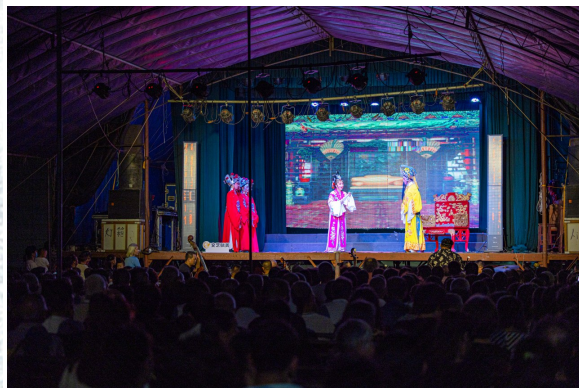
2023年8月28日晚，太平街道山下金村村民正在观看越剧演出《狸猫换太子》，村民们时不时拿出手机记录精彩瞬间，场上场下氛围热烈。