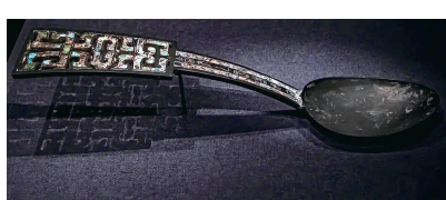
战国曾侯乙墓出土的铜匕

旨 的甲骨文字形(匕)像勺子送食 物入口 ;金文字形(匕)的下部变为 甘 ,突出品尝美味 ,小篆字形(旨)一脉 相承 ;隶变后 ,将下部的 甘 写作了 日 ,楷书写成 旨 。旨 的本义是 味 美 ,如《虽有佳肴》中的 虽有佳肴 ,不 食 不知其旨 。