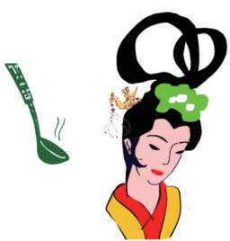
图示 (市三中教师 谢海斌绘)