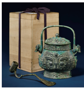
青铜兽面 纹提梁卣 和匕

据专家考证 ,这个器具很有可能就 是卣(y u),青铜卣有盖 ,有提梁 ,还有 一个与之配套的匕 ,用匕从卣当中把酒 舀出来。匕卣 合指宗庙祭祀 ,成语 匕 卣不惊 原指宗庙祭祀不受惊扰 ,后形容 军纪严明 ,军队所到之处 ,社会安定 ,百 姓不受惊扰。