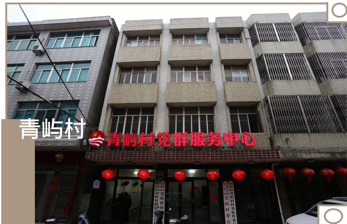
青屿村 青屿村党群服务中心