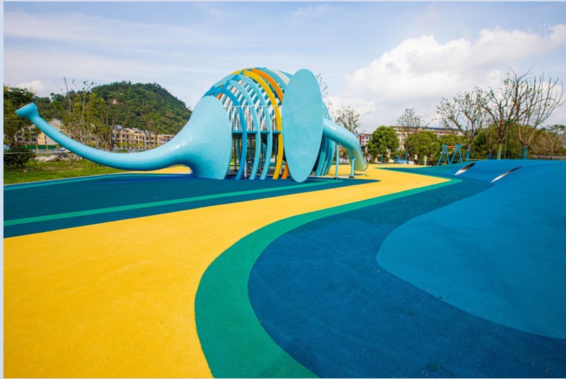
温岭农贸城北侧的 口袋公园。