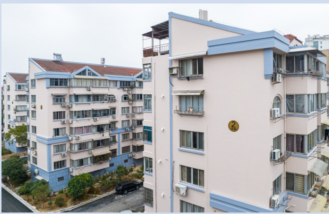
南屏小区一期外立面改造。

强化历史文化保护传承，坚定不移走 人城产文 深度融合发展之路。着力构建保护机制，建立健全历史文物保护单位、联动部门、镇（街道），系统推进全市历史文