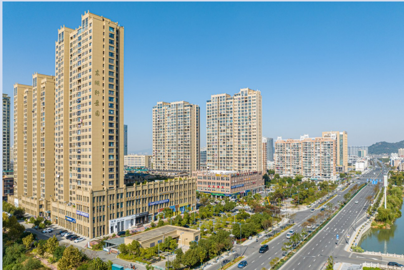
三星大道迎来改造升级。

开展燃气 大排查大整治 专项行动，全年开展燃气场站安全检查128次；居民用户安检65728户，覆盖率100%；老旧管线更换完成8.45公里，日均管网巡检166公里，全市金属软管使用覆盖率达100%。自建房整治百日行动 专项整治行动全面推进，对全市46.18万户自建房实现100%排查，排查数量居台州首位，同步完成全市88074户经营性自建房租居底数摸排及安全专项整治工作。