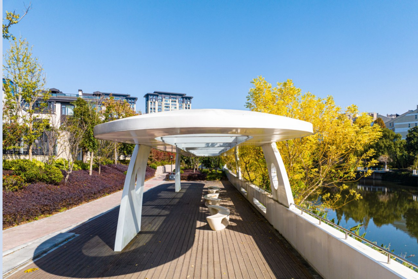
北山河东辉路口沿河绿地改造。