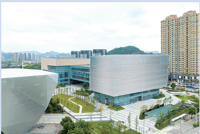
温岭文化中心（鲁班奖项目）。

优化提升营商环境。进一步加大工程建设审批制度改革力度，继续推进 串联 变 并联，推广并联办理范围，进一步探索优化联合验收即办审批。健全承诺制改革工作机制。进一步树立 围墙内的企业干、围墙外的政府办 的工作理念，建立事项提前对接业主机制，提供全流程指导服务。