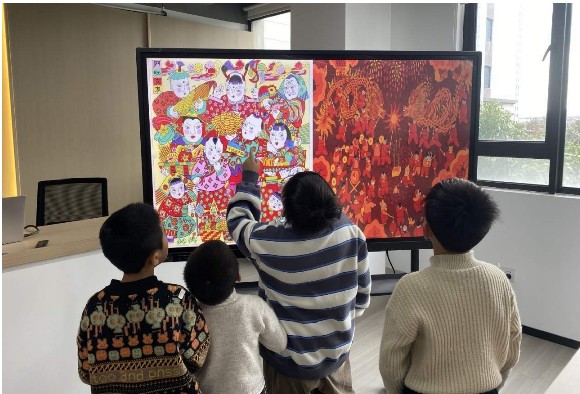
孩子们在欣赏年画。

横峰街道相关负责人表示，春节期间，街道将紧扣传承弘扬中华优秀传统文化，丰富居民群众精神文化生活，围绕营造喜庆祥和的节日氛围这一主线，持续开展各类 新生活·新风尚·新年画 文明实践活动，让辖区居民在家门口就能欢欢喜喜过新年。