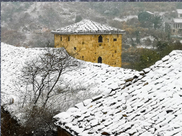
拍友 徐宏晖 摄