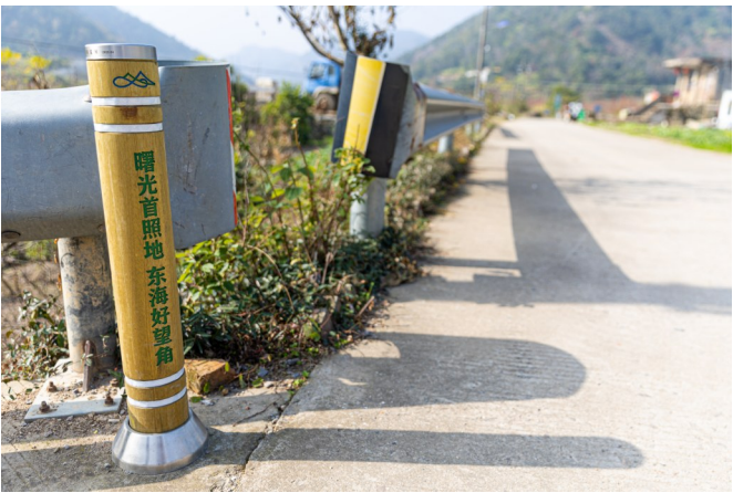
每500米左右，或者路口，都有设立引导柱。

如果你是登山爱好者，在环浙步道App上，你不仅可以发出动态，征集身边爱好者一起挑战线路，也可以将自己的登山游记分享发在App上。如果你已不满足于温岭的线路，在环浙步道App上还可以找到近期省内各地推出的自主打卡挑战赛。有兴趣去参与挑战，会产生年度、月度各时间段的排名榜单，还可获得相应的足迹积分。同时，App也具有一键求救功能，后台能直接看到运动人员所在的位置、海拔、天气情况等，保障了安全性。可以说，有了环浙步道App，路在脚下，同样也在掌中。