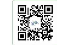
环浙步道App下载地址