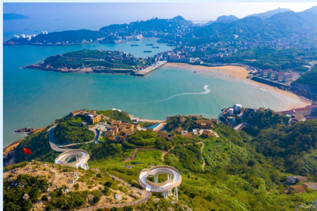
步道沿线的对戒平台。