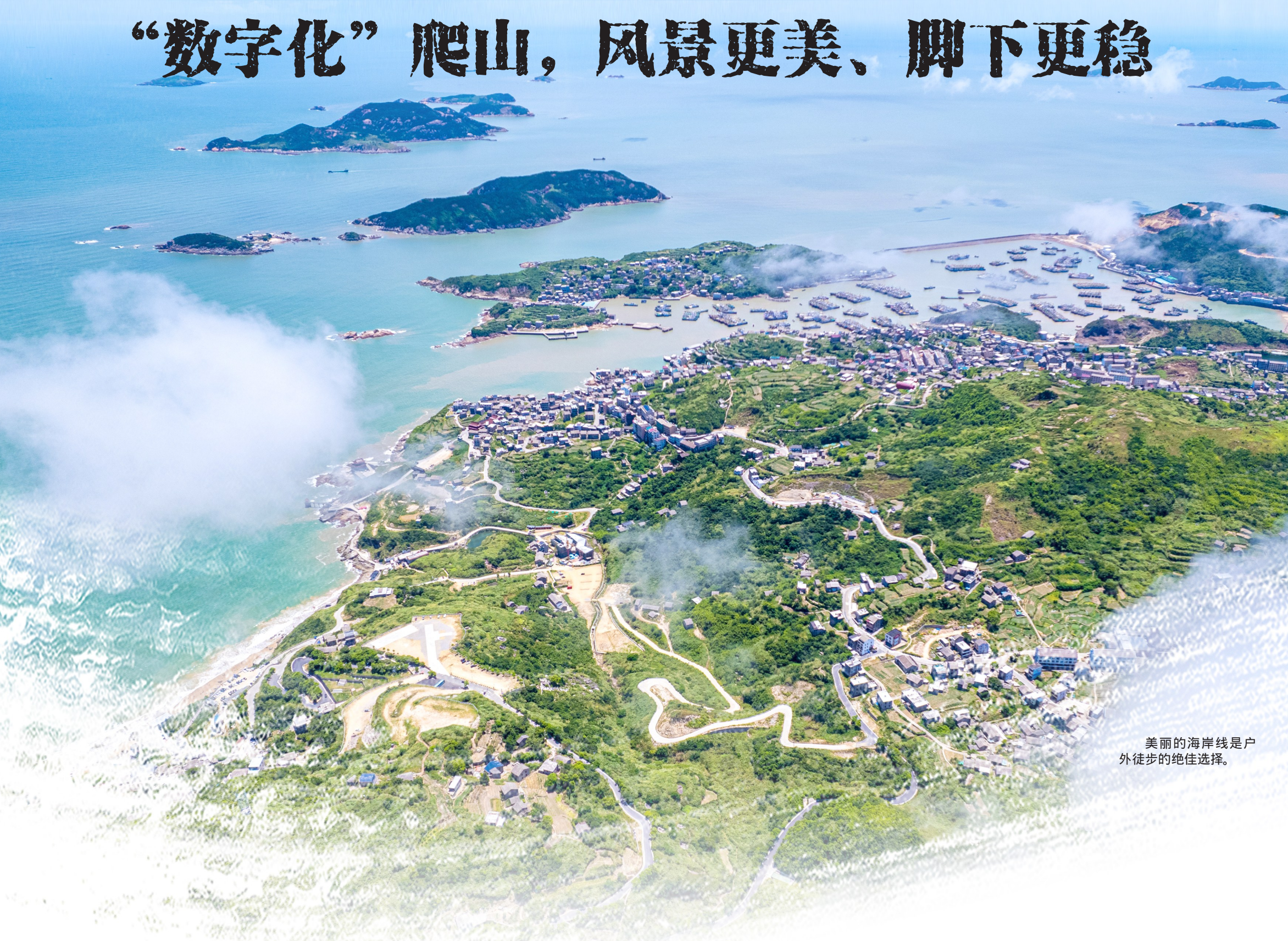
美丽的海岸线是户外徒步的绝佳选择。