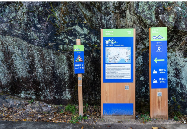
环浙步道沿路点位指示牌。