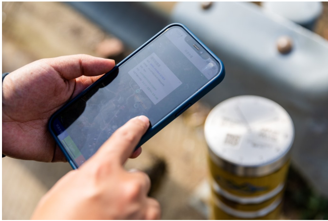
通过扫描引导柱上的二维码就能进入环浙步道App。