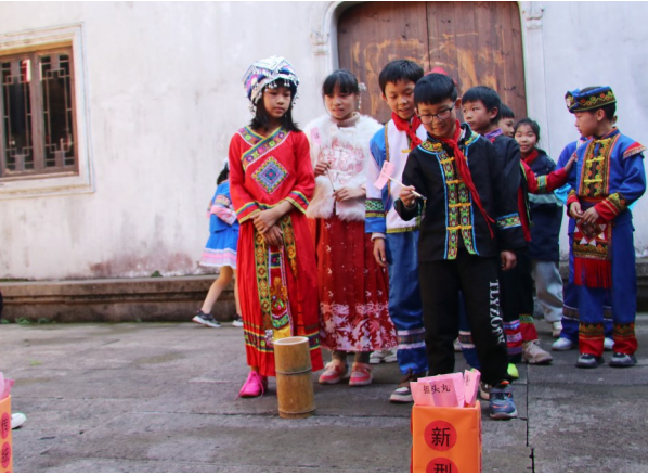
学生参与禁毒投壶游戏。

本报讯（记者姚天 通讯员王双双/图）为进一步强化青少年毒品预防教育，筑牢青少年思想防线，12月8日，温岭团市委、温峤镇联合温岭二小共同开展 共建无毒家园 共享健康青春 为主题的禁毒教育宣传活动，旨在让学生们在互动中学到禁毒知识，提高禁毒意识，全力营造 双零社区 创建的浓厚氛围。