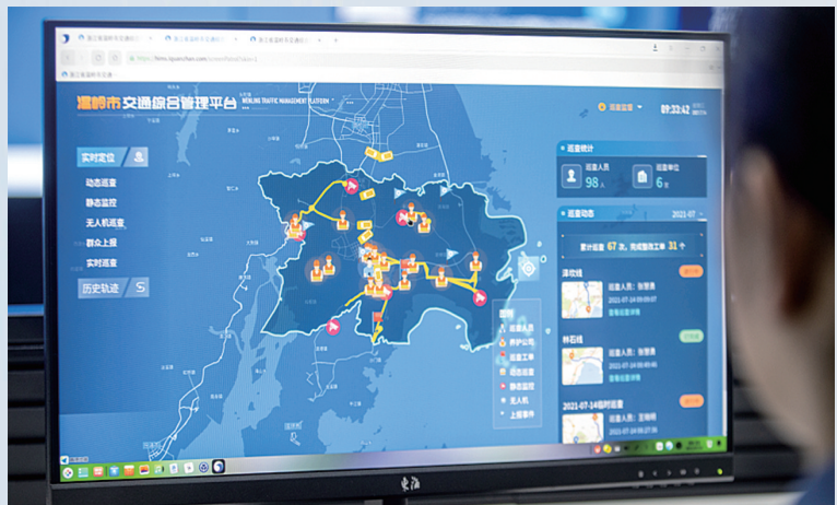
温岭交通综合管理平台。