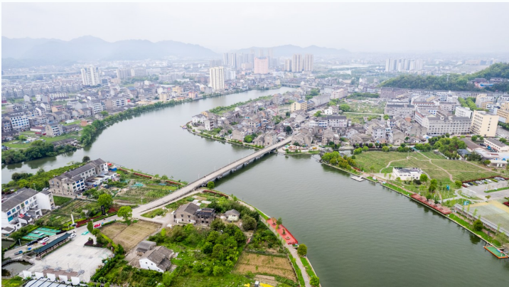
近年来，我市水环境得到显著提升。