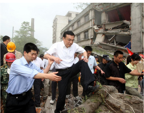
2008年5月19日,李克强同志在四川地震灾区察看灾情。