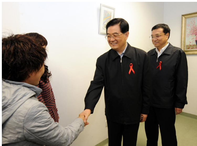
2008年12月1日是第21个世界艾滋病日。胡锦涛同志和李克强同志来到北京地坛医院考察艾滋病防治工作。