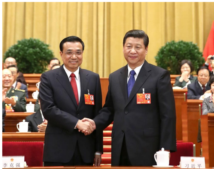
2013年3月15日,第十二届全国人民代表大会第一次会议在北京人民大会堂举行第五次全体会议。会议经过投票表决,决定李克强为中华人民共和国国务院总理。这是习近平同志和李克强同志亲切握手。