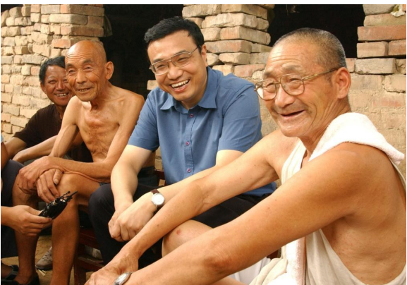
2003年8月8日,李克强同志在河南省新乡市调研。这是李克强同志在原阳县桥北马庄村与村民亲切交谈。

李克强同志认真贯彻落实党中央决策部署,坚持从中国国情出发,坚持和完善社会主义基本经济制度,持续推动经济体制改革,坚持社会主义市场经济改革方向,处理好政府和市场的关系,使市场在资源配置中起决定性作用,更好发挥政府作用,推动有效市场和有为政府更好结合。(下转第三版)