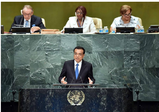
2016年9月21日,李克强同志在纽约联合国总部出席第71届联合国大会以“可持续发展目标:共同努力改造我们的世界”为主题的一般性辩论并发表题为《携手建设和平稳定可持续发展的世界》的讲话。