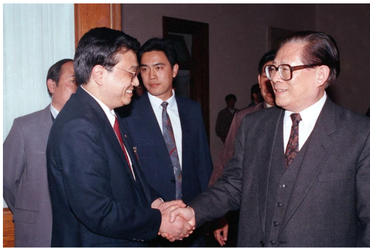
1993年5月3日下午,中国共产主义青年团第十三次全国代表大会在北京人民大会堂开幕。在5月3日上午的预备会议后,举行第一次主席团会议,推选李克强等同志为主席团常务主席。这是江泽民同志与李克强同志握手。