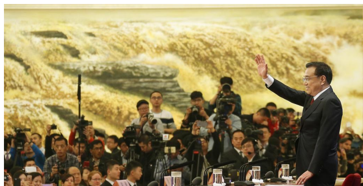
▲2016年3月16日,李克强同志在北京人民大会堂与中外记者见面,并回答记者提问。