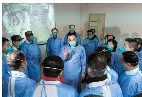
▲2020年1月27日,李克强同志赴湖北省武汉市考察指导疫情防控工作,代表党中央、国务院慰问疫情防控一线的医务人员。