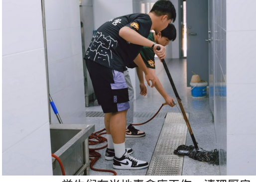
学生们在当地素食店工作，清理厨房。