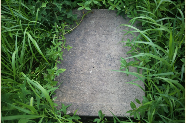
进士第的石块文物。