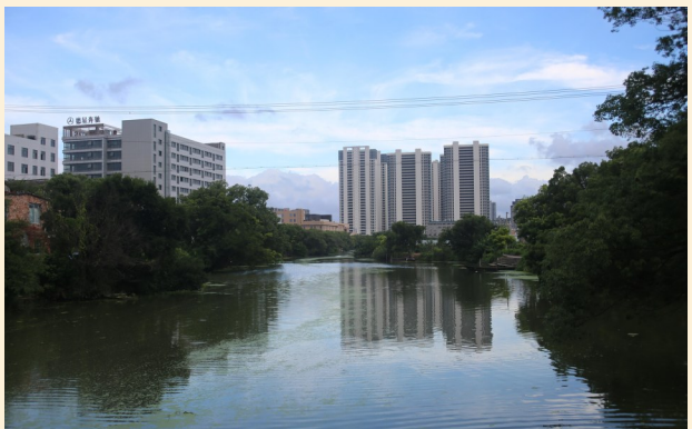
莞渭童村中路东河。