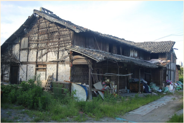
莞渭童村的老房子。