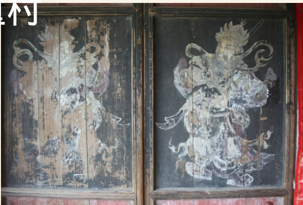
莞渭童村进士第门神画。

6月26日，因“百村行”采访，记者再次走进了莞渭童村，在路边的童氏家庙前，见到了温岭市文广新局2016年所立的一块碑，原来，铜盘出土地点莞渭童村原先被误写为楼旗村，立碑是为了正本清源。碑上介绍出土时间为1984年3月18日。