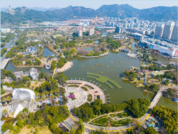
在各部门共同努力下，我市水环境得到有效提升。