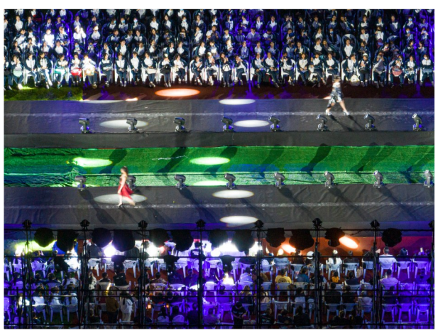
毕业服装秀吸引了众多学生前来观看。