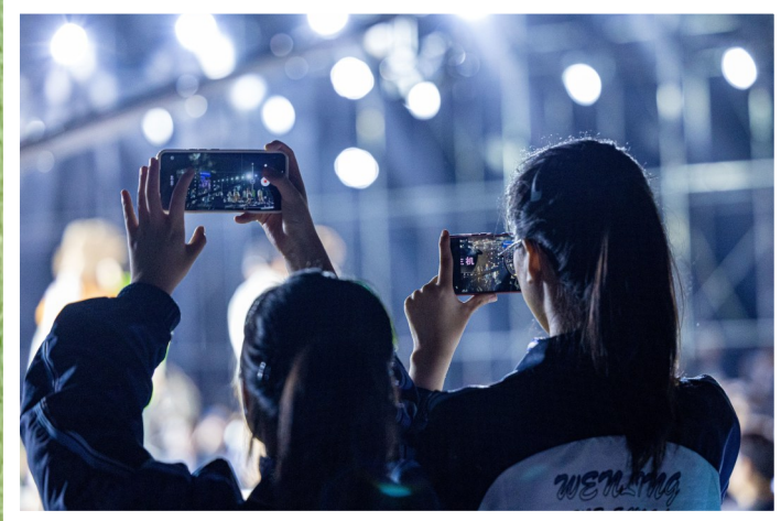
学生用手机记录下这难忘一刻。