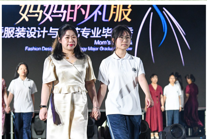
妈妈们身穿礼服，和孩子一起走上T台。