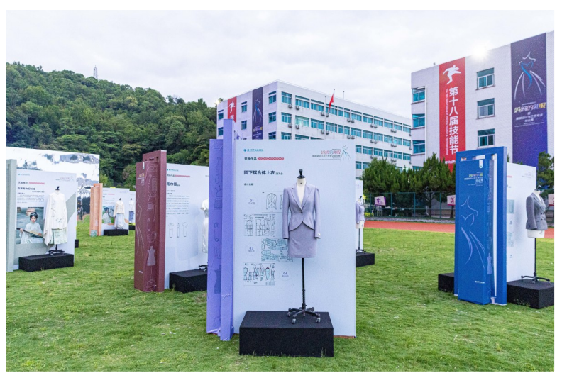
服装毕业设计静态展示区。