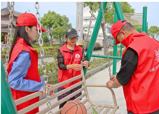
志愿者对秋千进行检修。

当天，志愿者们还对群众家门口自制的运动器材开展了检修服务。安全无小事，文明靠大家。大家纷纷表示，将提高体育运动安全意识，在日常锻炼过程中做到“一看、二查、三使用”，对存在安全隐患的运动器材，及时向村里或主管部门报告，