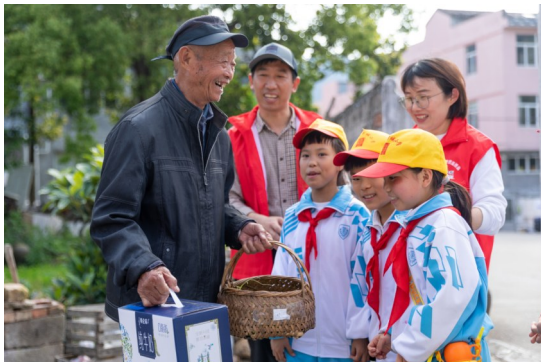
同学们把劳动果实送给孤寡老人。

在城南义工队义工的带领下，当天，同学们还把采摘来的蔬菜和水果送给了当地的孤寡老人。“我采摘了满满一大筐的豆荚、青菜和桑葚，最后