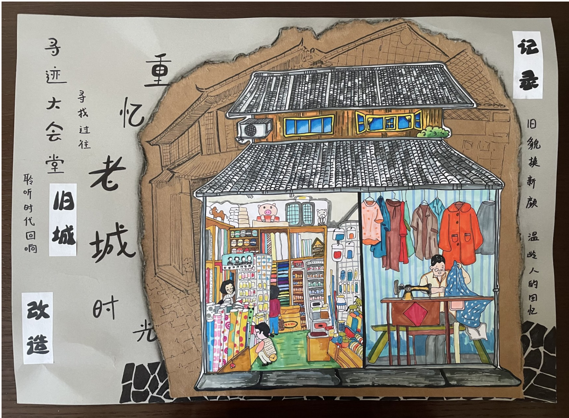
方城小学二(5)班 杜宣瑾 指导老师 林敏