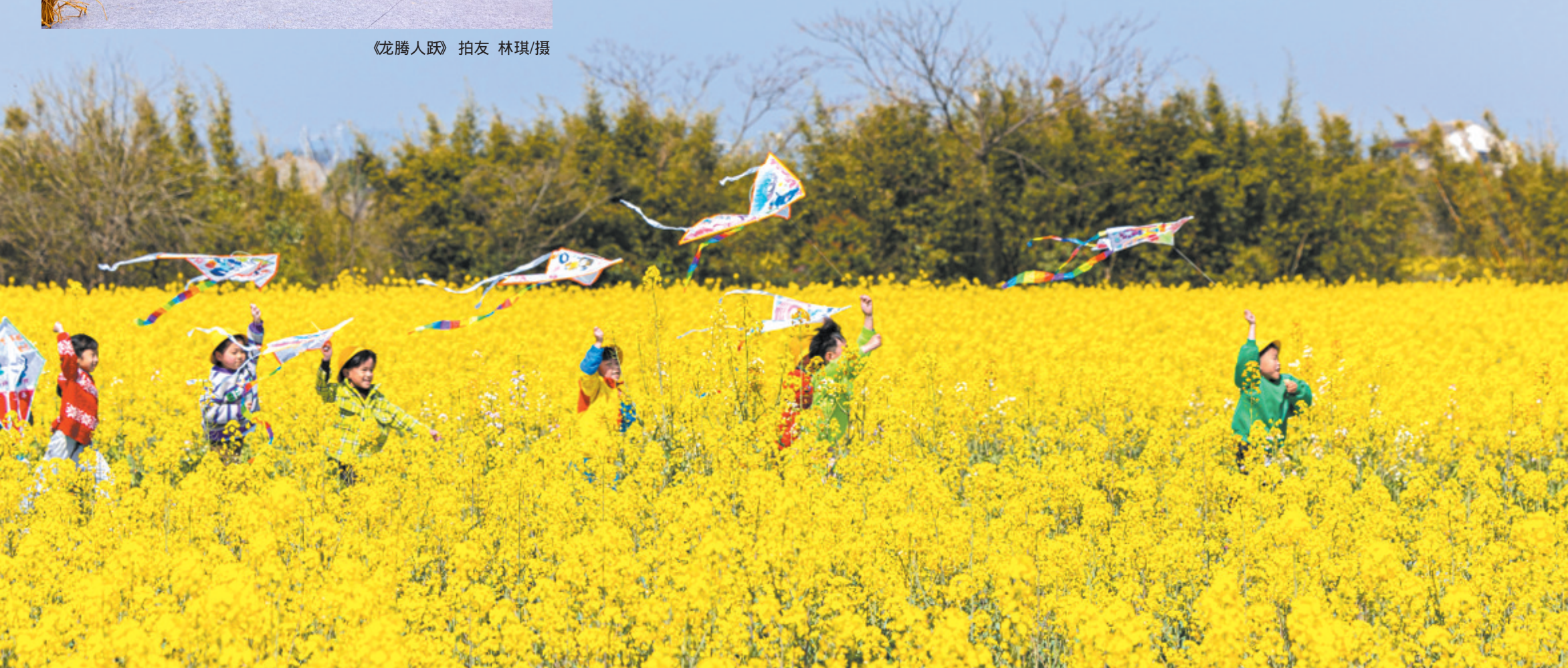
《放飞春天》