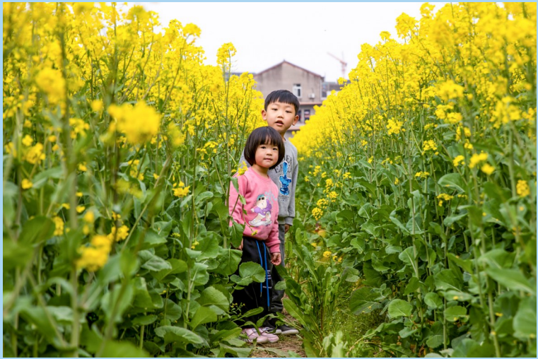
《兄妹赏花》