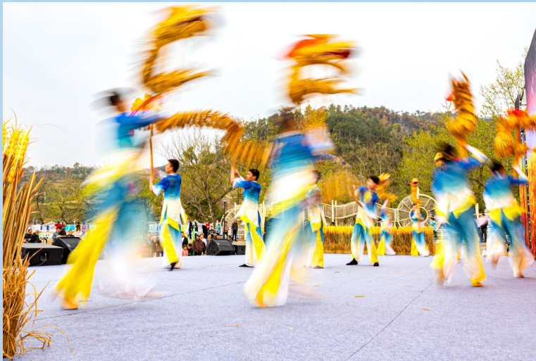
《龙腾人跃》