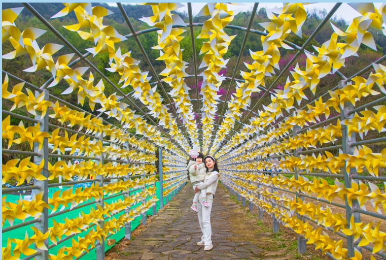
《放飞梦想》