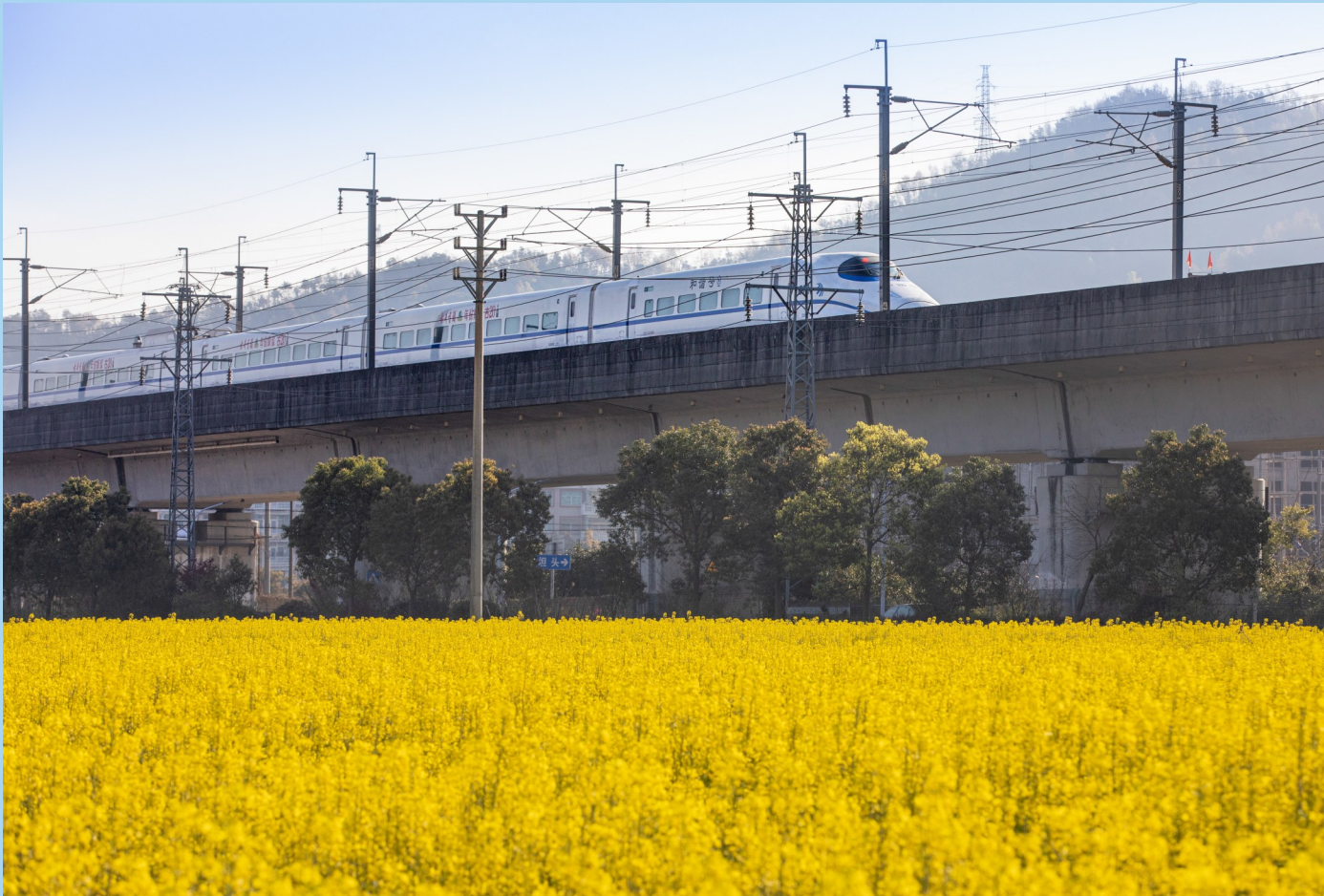
《开往春天的列车》