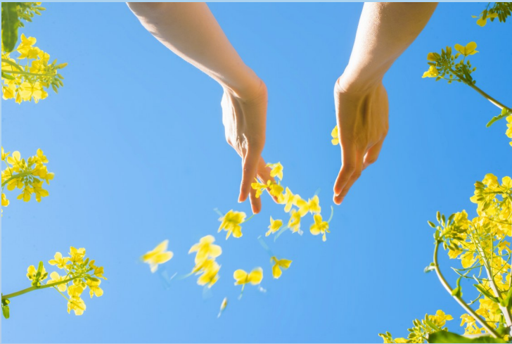
《风吹过田野》

阳春三月，草长莺飞，近日，温岭的花事一场接着一场。无论是山间田野，还是房前屋后，遍地金黄，随风轻舞，宛若千层波浪。每到此季，温岭大片的油菜花就进入盛花期，将三月盎然的生机和斑斓的美好诠释得淋漓尽致，恰似一幅多姿多彩的春日画卷。望着南宋诗人杨万里笔下“儿童急走追黄蝶”的田园美景，感受远离喧嚣红尘的淡淡清欢。置身于花海中，轻轻闭上眼，细细品味这盎然的春的气息，让身体来一次酣畅的花浴。漫步花海，尽享闲情逸致，不经意间，入了镜，绘了画，暖了心，又是一年春来到。